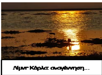
Λίμνη Κάρλα αναγέννηση...

Κρυφά το πίνει η κλεφτουριά και το λαιμό σηκώνει σαν το σπουργίτι και βλογά τη φτωχομάνα Ελλάδα.’